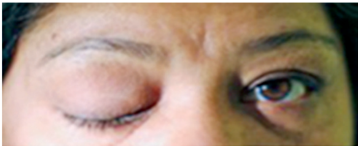
FIGURA 2. Anisocoria a expensas de midriasis del ojo derecho, desviación de la mirada hacia abajo y afuera e iridoplejía ipsilateral.

La falta de información sobre la lesión completa del tercer par craneal, aunada a las múltiples patologías que pueden condicionarla, convierten a esta enfermedad en un reto diagnóstico para el médico, sobre todo en el primer nivel de atención. Por esto es necesario documentar los casos y generar conocimiento que permita orientar sobre las conductas de abordaje, ya que tener un diagnóstico temprano puede dar más tiempo al paciente y al personal médico para la toma de decisiones sobre las medidas terapéuticas o preventivas de complicaciones mayores.